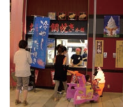
★ 48号店 2008年11月 おめで鯛焼き本舗 スマーク伊勢崎店 株式会社アーミップ