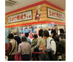
★ 56号店 2009年10月 おめで鯛焼き本舗 新百合ヶ丘エルミロード店 直営