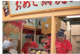
5号店 2006年1月 おめで鯛焼き本舗 本牧店 MLB・JAPAN