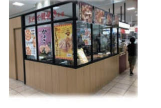
★83号店 2016年12月 おめで鯛焼き本舗 マルフファミリー志木店 直営