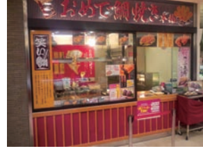
67号店 2010年12月 おめで鯛焼き本舗 京王多摩センター店 直営