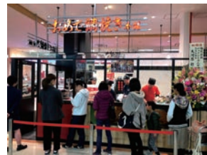
92号店 2019年3月 おめで鯛焼き本舗 ゆめタウン大江店 株式会社ロンド