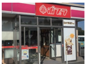
★90号店 2018年10月 おめで鯛焼き本舗 水戸鯉淵店 株式会社ミツウロコプロビジョンズ