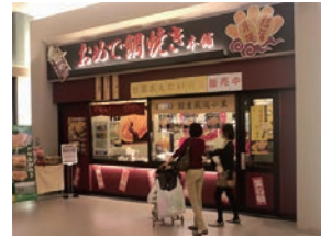
43号店 2008年10月 おめで鯛焼き本舗 越谷レイクタウン店 株式会社フラップインターナショナル