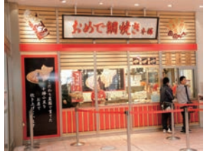
★ 39号店 2007年11月 おめで鯛焼き本舗 川口前川店 株式会社日本シライサービス