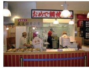
10号店 2006年3月 おめで鯛焼き本舗 藤井寺店 有限会社豊三→直営