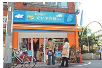
13号店 2006年4月 夢ある街のたいやき屋さん 荏原町店 株式会社エンタイトル