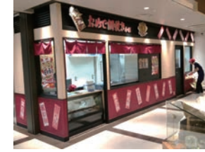
78号店 2014年9月 おめで鯛焼き本舗 津チャム店 株式会社コムライン