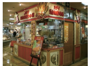
ゑびす黄金鯛焼き 千葉三越店 直営