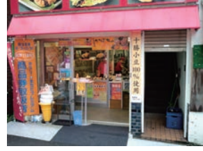
70号店 2011年4月 夢ある街のたいやき屋さん 原町田店 株式会社まちだ商連