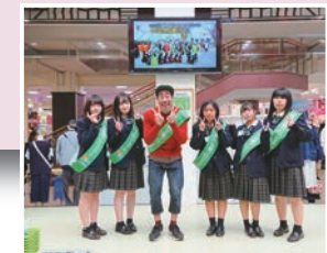
福島での忘れな草プロジェクト タレントのなすびさんも応援に。

6月 西日本豪雨の被災地へ寄附 (岡山、広島、愛媛) 9月 同時に、八雲町へ寄附 北海道胆振東部地震の影響で、域学交流を翌年2月に延期 以降、特別寄付金の枠を創設