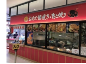
88号店 2018年3月 おめで鯛焼き本舗 アピタテラス横浜綱島店 株式会社フラップインターナショナル