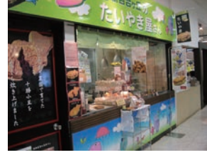
31号店 2007年4月 夢ある街のたいやき屋さん 新百合ヶ丘店 株式会社エンタイトル