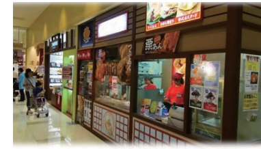
75号店 2013年6月 おめで鯛焼き本舗 ザ・マーケットプレイス東大和店 株式会社アーミupp