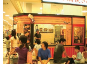
★64号店 2010年9月 おめで鯛焼き本舗 アリオ深谷店 株式会社アーミupp