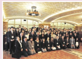
第4回コンベンション (センチュリーコート丸の内)