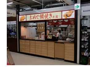
82号店 2016年11月 おめで鯛焼き本舗 藤沢駅前店 株式会社フクシマ商事