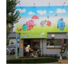
55号店 2009年9月 夢ある街のたいやき屋さん 前橋国領店 株式会社アーミップ