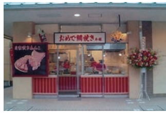
9号店 2006年3月 おめで鯛焼き本舗 昭島モリタウン店 直営