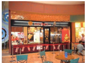
42号店 2008年7月 おめで鯛焼き本舗 イオンモール東浦店 株式会社コムライン