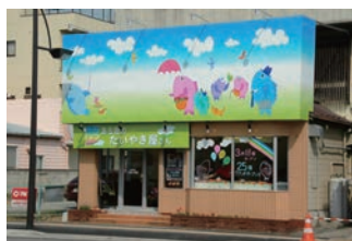
12号店 2006年3月 夢ある街のたいやき屋さん 前橋六供店 株式会社アーミupp