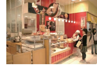
46号店 2008年10月 おめで鯛焼き本舗 大丸ららぽーと横浜店 株式会社エンタイトル