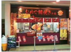
72号店 2011年9月 おめで鯛焼き本舗 メグリア店 株式会社コムライン