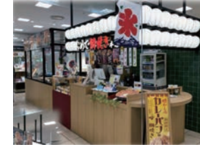
★81号店 2016年9月 おめで鯛焼き本舗 アピタ金沢文庫店 直営