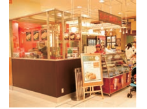
50号店 2008年12月 おめで鯛焼き本舗 大丸浦和パルコ店 株式会社日本シライサービス