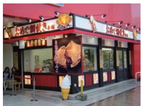
おめで鯛焼き本舗 熊谷店 直営