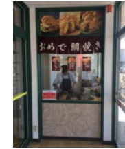
87号店 2018年11月 おめで鯛焼き本舗 MG一宮戸塚店 株式会社ミツウロコプロビジョンズ