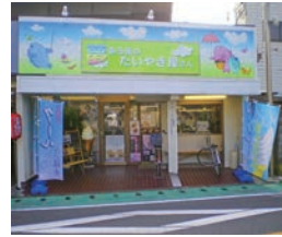
44号店 2008年10月 夢ある街のたいやき屋さん 大原店 平手光明