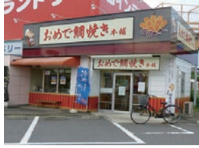
★ 33号店 2007年9月 おめで鯛焼き本舗 高崎並榎店 株式会社アーミップ