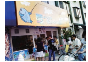
17号店 2006年5月 夢ある街のたいやき屋さん 流町店 有限会社エムズ