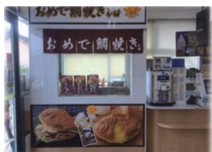
★93号店 2019年3月 おめで鯛焼き本舗 MG荘園店 株式会社ミツウロコプロビジョンズ