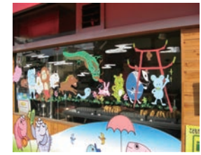
26号店 2006年10月 夢ある街のたいやき屋さん 宇都宮陽西通店 株式会社JIDハーモニー→株式会社アーミupp