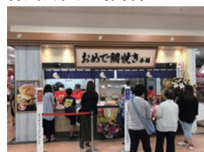
★95号店 2019年9月 おめで鯛焼き本舗 アピタ向山店 株式会社江崎商店