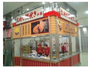
14号店 2006年4月 おめで鯛焼き本舗 錦糸町東急店 直営