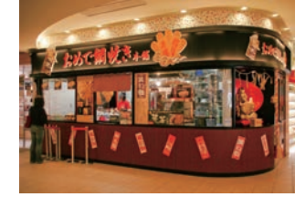
49号店 2008年11月 おめで鯛焼き本舗 イオンモール岡崎店 株式会社コムライン