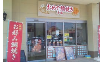
74号店 2013年3月 おめで鯛焼き本舗 フォレストモール新前橋店 株式会社アーミupp