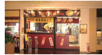
45号店 2008年10月 おめで鯛焼き本舗 エアポートウォーク店 有限会社ハヤシフーズ