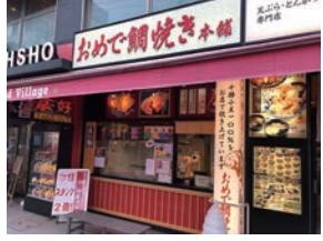
★66号店 2010年11月 おめで鯛焼き本舗 湘南台店 株式会社フクシマ商事