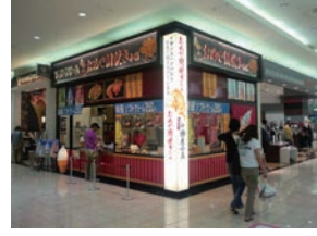
★71号店 2011年4月 おめで鯛焼き本舗 イオンモール大和店 株式会社フクシマ商事