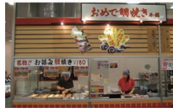
★ 32号店 2007年4月 おめで鯛焼き本舗 湘南モールフィル店 株式会社フクシマ商事