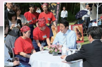
安倍総理と障がい者の集い

10月 一般社団法人ほのぼの運動協議会に。それに伴い体制改革を行う ロゴ制定 コンベンションからフォーラムへ名称を変え、支援団体との交流の場になる