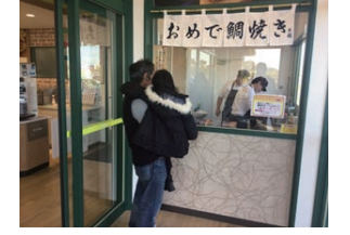
86号店 2017年12月 おめで鯛焼き本舗 MG神戸柳瀬店 株式会社ミツウロコプロビジョンズ