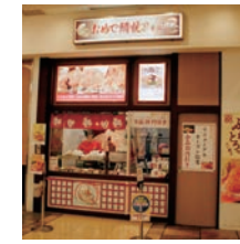
★25号店 2006年9月 おめで鯛焼き本舗 ラゾーナ川崎店 直営