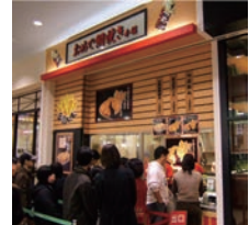
37号店 2007年10月 おめで鯛焼き本舗 エルミ鴻巣店 直営