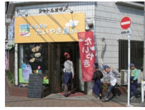
8号店 2006年3月 夢ある街のたいやき屋さん 立川富士見町店 株式会社アイテム→有限会社メディア・サーカス