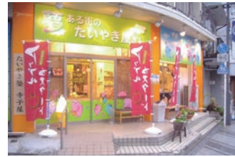
★4号店 2006年1月 夢ある街のたいやき屋さん 戸越銀座店 直営