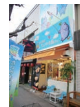
27号店 2006年11月 夢ある街のたいやき屋さん 浦和田嶋店 株式会社日本シンライサービス