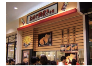
★28号店 2006年11月 おめで鯛焼き本舗 らぼーと柏の葉店 直営