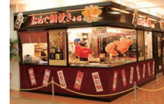
51号店 2009年2月 おめで鯛焼き本舗 シャオ西尾店 株式会社コムライン