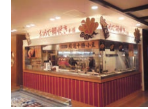
79号店 2014年10月 おめで鯛焼き本舗 東名高速道路下り足柄SA店 直営