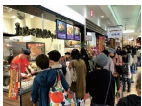
★96号店 2019年10月 おめで鯛焼き本舗 セルバ仙台店 株式会社リンク