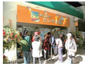
11号店 2006年3月 夢ある街のたいやき屋さん 笹塚店 株式会社さわやか