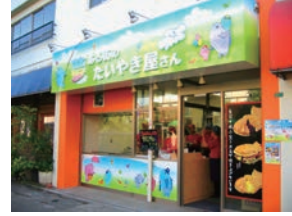
34号店 2007年9月 夢ある街のたいやき屋さん 西調布店 株式会社FVP