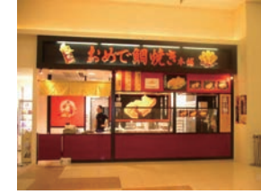
54号店 2009年8月 おめで鯛焼き本舗 イオン大垣店 有限会社ハヤシフーズ