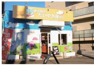
6号店 2006年2月 夢ある街のたいやき屋さん つくば竹園店 株式会社ケーアンドアイ