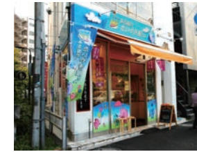
19号店 2006年6月 夢ある街のたいやき屋さん 西大島店 有限会社ベルカンパニー