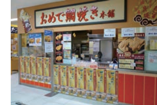
52号店 2009年3月 おめで鯛焼き本舗 高崎スズラン店 株式会社アーミップ