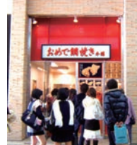
38号店 2007年11月 おめで鯛焼き本舗 ミーナ津田沼店 有限会社ベルカンパニー