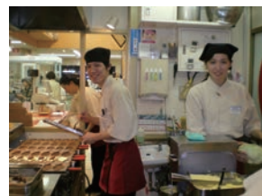
★ゑびす黄金鯛焼き 町田小田急店 直営