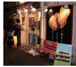
7号店 2006年2月 夢ある街のたいやき屋さん 学芸大学店 ポレッタ・ジャパン