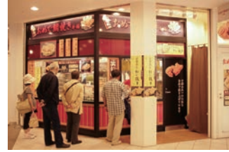
★65号店 2010年10月 おめで鯛焼き本舗 トツカーナモール店 株式会社フクシマ商事