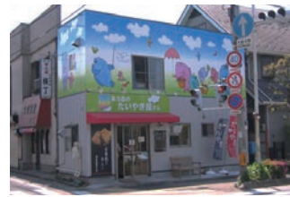
★1号店 2005年10月 (2020年リニューアル) 夢ある街のたいやき屋さん The Peanuts 与野店 有限会社メディア・サーカス