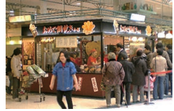
★ 40号店 2008年4月 おめで鯛焼き本舗 アイモール三好店 株式会社コムライン