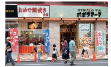
23号店 2006年9月 おめで鯛焼き本舗 新所沢店 株式会社ポポラマーマ