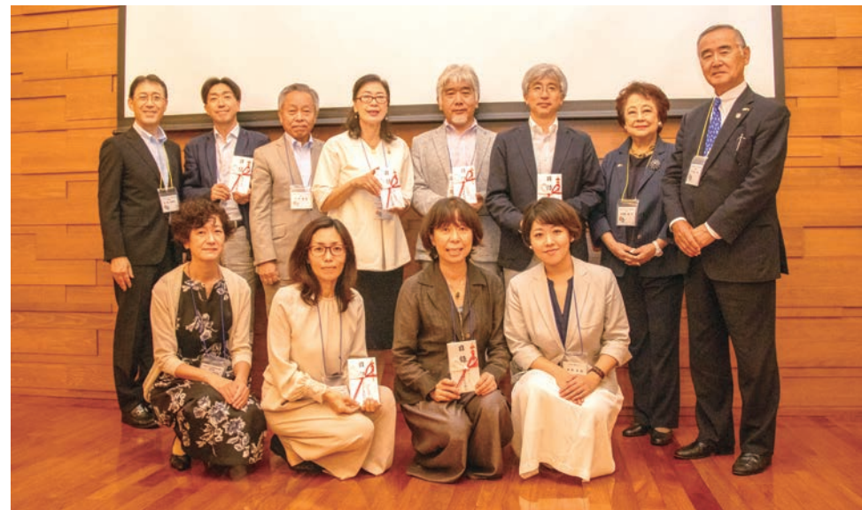
2019年 第13回ほのぼのフォーラムの目録授与式にて