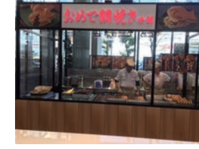
★85号店 2017年11月 おめで鯛焼き本舗 丸井錦糸町店 直営