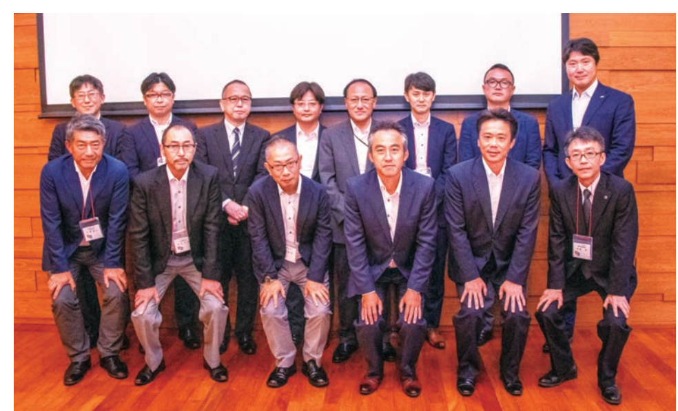
2019年 第13回ほのぼのフォーラムにご参加いただいた別会員企業のみなさま