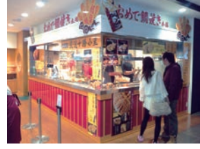
★68号店 2011年3月 おめで鯛焼き本舗 友部サービスエリア店 株式会社東武食品