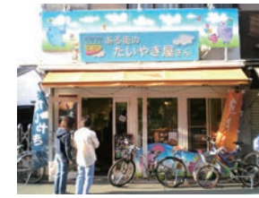
24号店 2006年9月 夢ある街のたいやき屋さん 武蔵小金井店 株式会社ピーエフ・プランニング