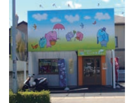
53号店 2009年4月 夢ある街のたいやき屋さん 高崎高関店 株式会社アーミップ