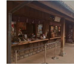
★76号店 2013年12月 文楽焼本舗 羽生SA上り店 直営