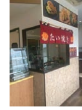
★84号店 2017年10月 おめで鯛焼き本舗 MG木曾三川公園店 株式会社ミツウロコプロビジョンズ