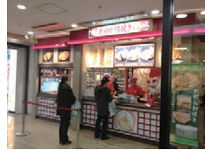
73号店 2013年2月 おめで鯛焼き本舗 センター北あいたい店 株式会社フクシマ商事