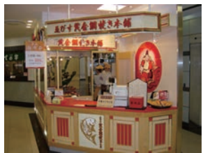
ゑびす黄金鯛焼き 国分寺丸井店 直営