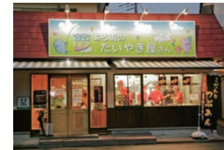
★ 57号店 2009年11月 夢ある街のたいやき屋さん 若松町店 社会福祉法人翔の会