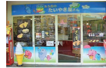
16号店 2006年5月 夢ある街のたいやき屋さん 加美店 有限会社エムズ