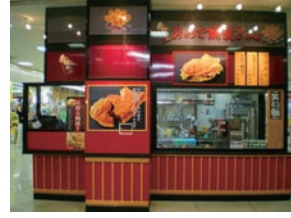
62号店 2010年7月 おめで鯛焼き本舗 ジャスコ長岡店 株式会社大島屋