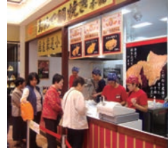
35号店 2007年10月 おめで鯛焼き本舗 アクアウォーク大垣店 有限会社ハヤシフーズ