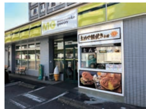
★91号店 2018年11月 おめで鯛焼き本舗 大空団地店 株式会社ミツウロコプロビジョンズ