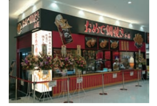
77号店 2014年4月 おめで鯛焼き本舗 ベニバナウォーク桶川店 株式会社フラップインターナショナル