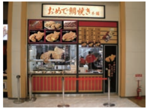
★ 30号店 2007年3月 おめで鯛焼き本舗 トレッサ横浜店 直営