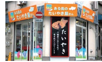
18号店 2006年5月 夢ある街のたいやき屋さん 阿佐ヶ谷店 株式会社新宿たいやき本舗