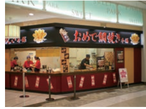
★ 41号店 2008年3月 おめで鯛焼き本舗 宇都宮ベルモール店 株式会社アーミップ