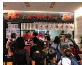
94号店 2019年9月 おめで鯛焼き本舗 サクラマチクマモト 店 株式会社ロンド