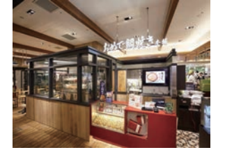
★80号店 2015年11月 おめで鯛焼き本舗 アトレ浦和店 直営