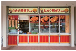
60号店 2010年4月 おめで鯛焼き本舗 東名高速道路上り足柄SA店 直営