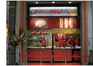
58号店 2009年11月 おめで鯛焼き本舗 イオンモールむさし村山店 株式会社FVP →株式会社アーミップ