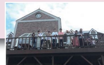
域学交流のシンボル

3月 忘れな草プロジェクトを巣鴨で開催 4月 以降同プロジェクトのみの協力受付開始 忘れな草プロジェクトを東北で開催