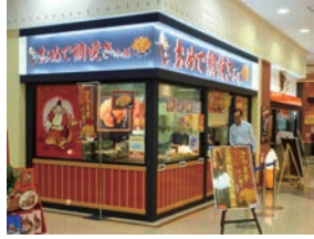
63号店 2010年8月 おめで鯛焼き本舗 アピタ代田橋店 株式会社ハヤシフーズ