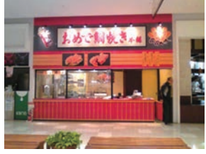
69号店 2011年3月 おめで鯛焼き本舗 リバーサイド千秋店 株式会社大島屋