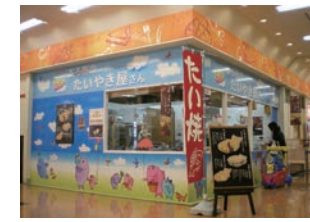
22号店 2006年8月 夢ある街のたいやき屋さん アビタ東海荒尾店 有限会社ハヤシフーズ