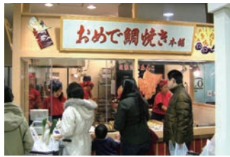
3号店 2005年12月 おめで鯛焼き本舗 布施店 有限会社豊三