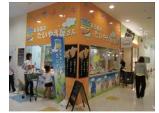
20号店 2006年7月 夢ある街のたいやき屋さん 綾瀬タウンヒルズ店 株式会社ポポラマーマ