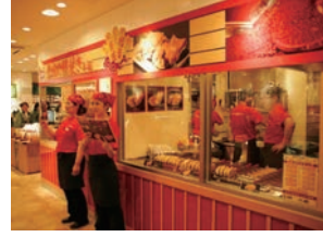
61号店 2010年6月 おめで鯛焼き本舗 新宿ハルク店 直営