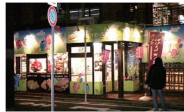
2号店 2005年12月 夢ある街のたいやき屋さん 立川南店 株式会社アイテム