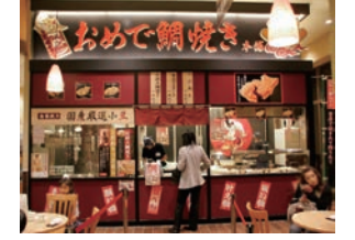
47号店 2008年11月 おめで鯛焼き本舗 ララガーデン川口店 有限会社ベルカンパニー