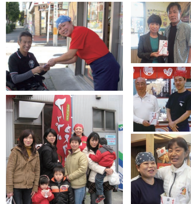
各店のオーナー、スタッフによる目録の贈呈式や差し入れの風景